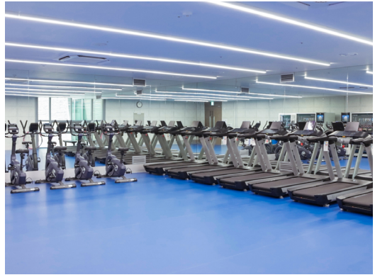
에너지와 건강을 되찾는 운동 공간