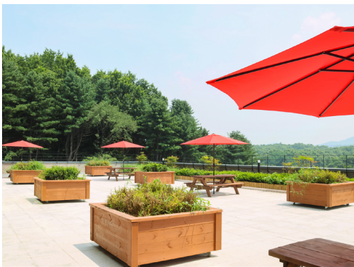
푸른 자연과 함께하는 여유로운 휴식 공간