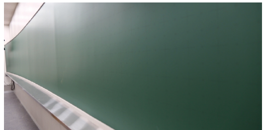
강의실 좌우 끝에서도 잘 보이도록 곡면 와이드 칠판 설치