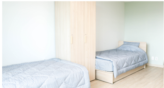
개인 용품을 넉넉히 보관할 수 있는 일룸(loom) 개인별 옷장 제공