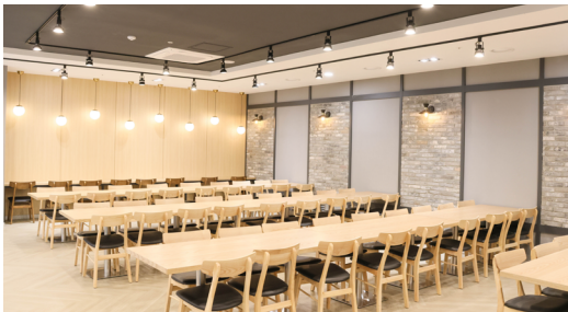
분위기 좋은 레스토랑 같은 식당

답답한 일상 속에서 공부를 지속해야 하는 학생들을 위해 학습공간뿐 아니라 잠시 머무는 공간에도 많은 정성을 담았습니다. 감성적이고 깔끔한 인테리어가 돋보이는 식당은 마치 분위기 좋은 레스토랑에서 식사한다는 기분이 들게 하며, 1인 식사를 선호하는 학생을 위해 별도의 공간을 만들어 조용한 분위기 속에서 차분히 식사할 수 있도록 하였습니다.