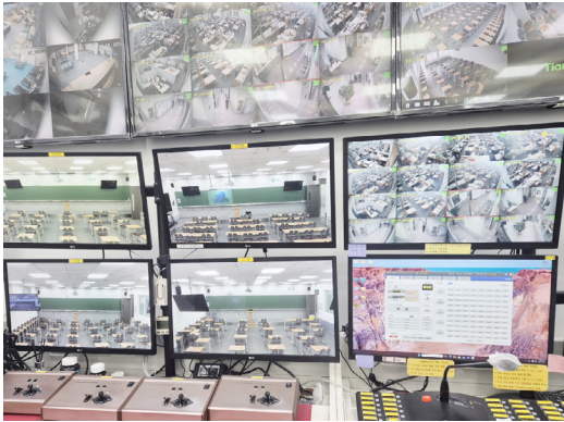
학생 안전을 책임지는 상황 통제실