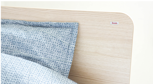
일룸(loom) 침대와 매트리스(하드 타입)를 설치

잠을 어떻게 자느냐에 따라 하루의 성과가 결정될 만큼 잠자리는 매우 중요합니다. 특히, 낮선 환경에서 생활하는 학생일수록 잠자리에 민감하게 반응하기 쉽습니다. 이런 문제를 해소하기 위해 여학생 전문관 러셀 기숙학원은 가구 전문 브랜드 일룸(loom)에서 침대와 매트리스(하드 타입)를 구매하여 모든 숙소에 설치하였으며, 숙소 생활의 답답함을 최소화하기 위해 1층 침대로만 숙소를 구성하였습니다.