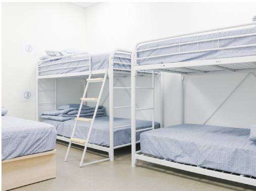
학생들의 건강을 지켜주는 보건실