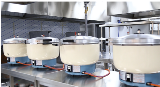
밥맛을 살려주는 압력밥솥 설치