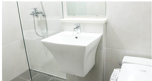
깔끔한 인테리어의 숙소 화장실