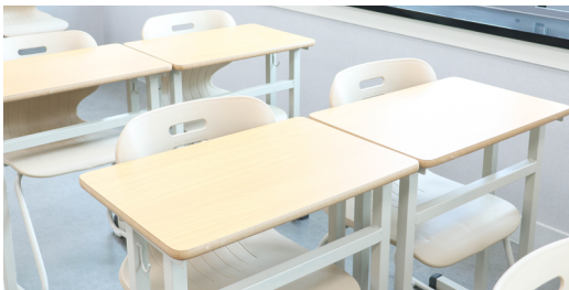
허리에 편한 의자 설치