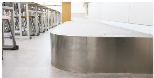
일반 단상보다 10cm가량 높은 25cm로 단상 설계