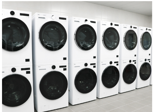
숙련된 인력이 관리하는 위생적인 세탁 시스템