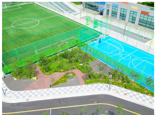
몸과 마음에 활력을 더하는 야외 공간