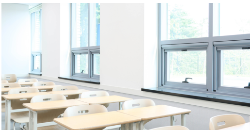
강의실 곳곳에 자연 채광이 들어오도록 설계

수업에 집중하는 학생들의 모습을 선생님이 한눈에 담을 수 있도록 강의실 단상의 높이를 일반 단상보다 10cm가량 높은 25cm로 설계했으며, 수업 내용이 빠르게 담길 칠판은 강의실 좌우 끝에서도 잘 보이도록 곡면 와이드 칠판으로 설치하여 수업 중 학생들이 편히 공부할 수 있도록 세밀한 부분까지 신경을 썼습니다.