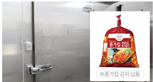
김치 신선도를 유지할 수 있도록 김치냉장고 설치