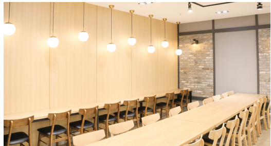
1인 식사를 선호하는 학생들을 위한 1인용 테이블 설치